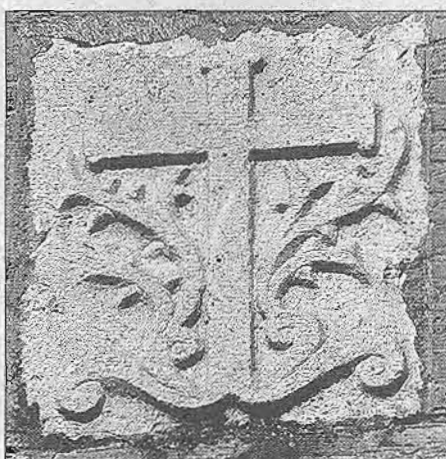
Escudo de Santa Cruz, situado en la fachada principal de la Biblioteca Pública Municipal.

«... y eso mismo entre Aurelia, y Alharilla la villa de Santa Cruz que para distin-